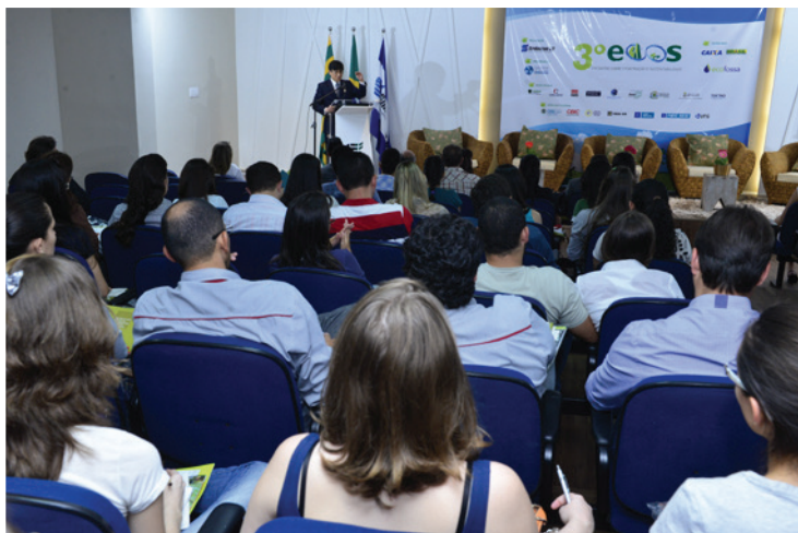
3º Encontro sobre Construção e Sustentabilidade (Ecos)

Visa promover o desenvolvimento da indústria da construção, agindo por meio da oferta de qualificação técnica, com objetivo de contribuir com a melhoria dos sistemas e métodos construtivos, melhoria da qualidade dos insumos, entre outros.