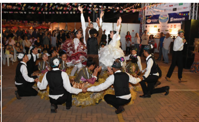
Realização da 14ª edição da Festa Junina do NPQ, em junho de 2016