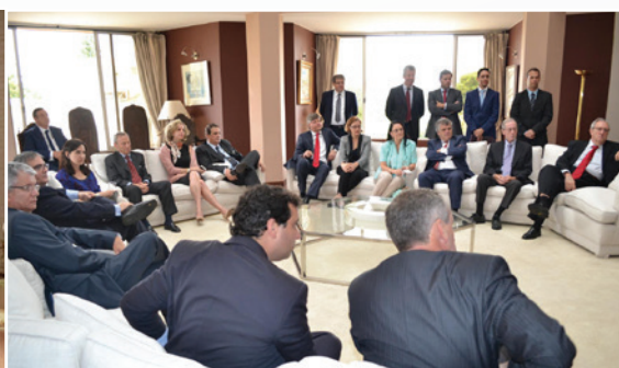
Reunião na Embaixada da Espanha, em Brasília, com delegação de empresários espanhóis