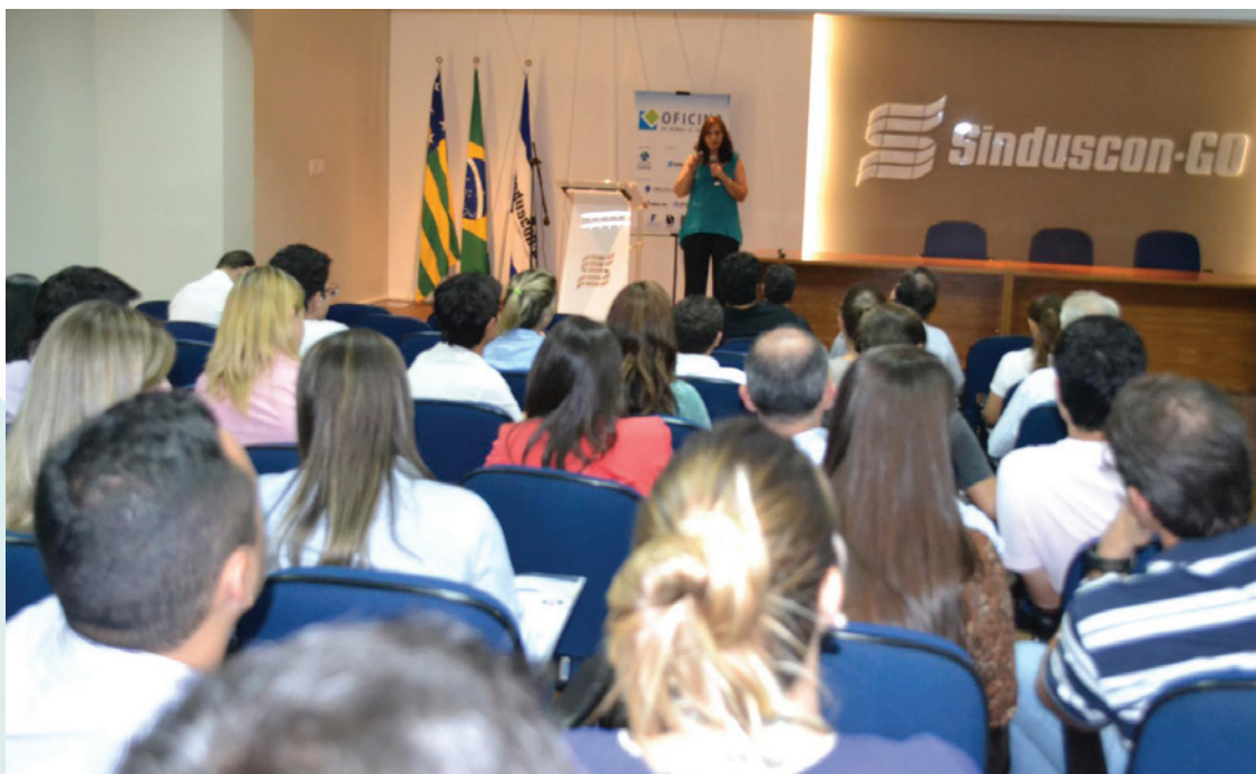
Em 05 de fevereiro de 2015, foi realizado módulo sobre “Esquadrias e Guarda-Corpos”