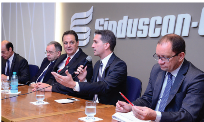
Diálogo com o TCU, promovido para sanar dúvidas e alinhar questões conflituosas

Visa promover a melhoria do ambiente de negócios, avaliação de mercado, desenvolvimento da gestão empresarial, etc.