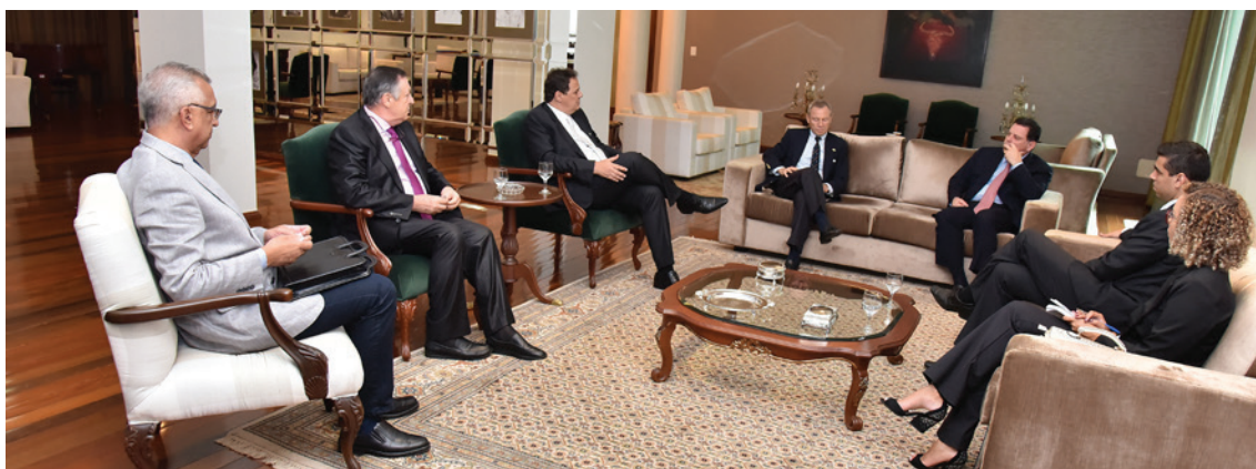
Parceria do setor da indústria da construção e Governo do Estado de Goiás com a Embaixada da Espanha, visando aproximar as empresas espanholas das empresas goianas. Objetivo: participação nos processos de PPPs e Concessões a serem lançados pelo Estado de Goiás. Foram realizados encontros com participação ativa do Sinduscon-GO, com a presença do Embaixador da Espanha no Brasil