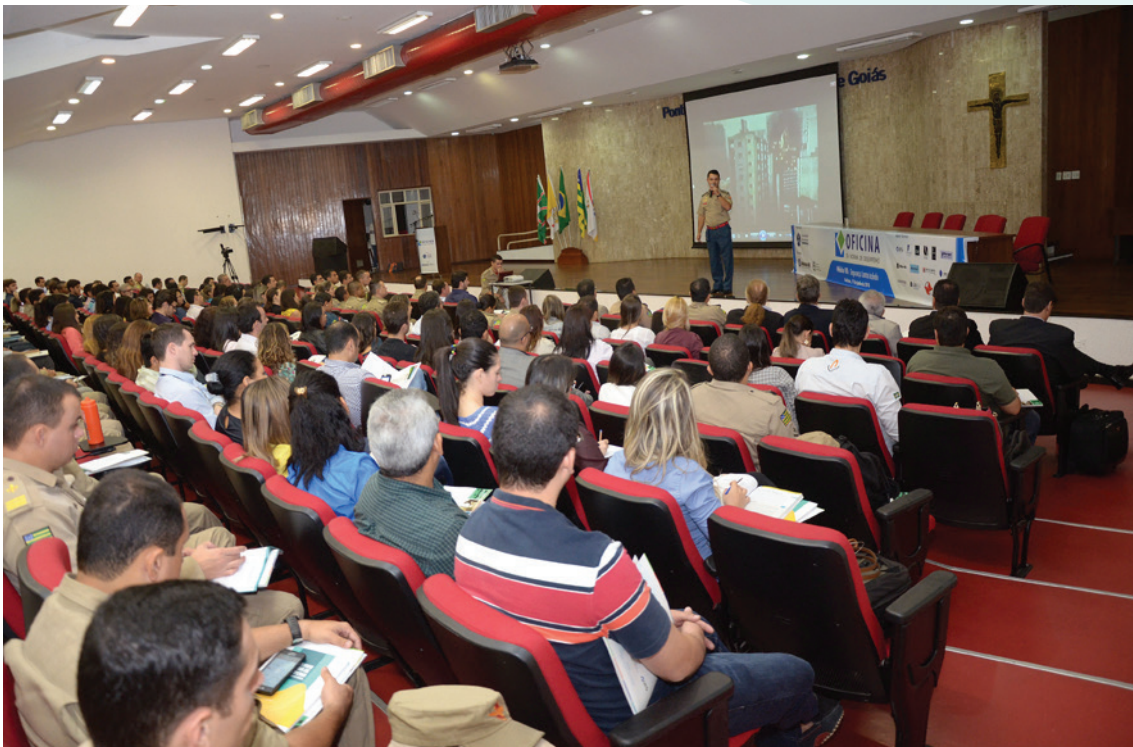
Em 17 de junho de 2015, o módulo abordou a “Segurança Contra Incêndio”