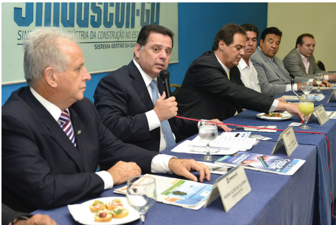
Registro da presença do governador do Estado de Goiás, Marconi Perillo, quando tratou sobre as prioridades em infraestrutura para o Estado em sua gestão

Mensalmente, realiza Reuniões de Diretoria, visando abordar sempre assuntos de interesse coletivo do setor. Nestas ocasiões, procura trazer renomados especialistas, secretários de governo, presidentes de agências e de entidades de classe, abrindo espaço para a construção conjunta de soluções.