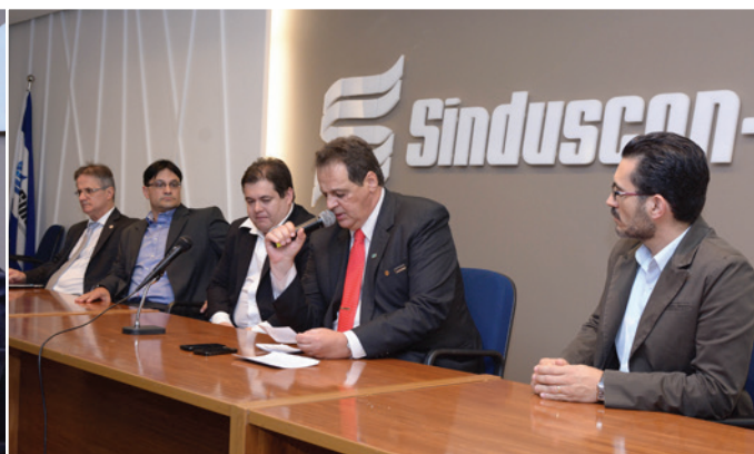
Encontro Empresarial – Tendências em Gestão, Inovação e Sustentabilidade na Construção