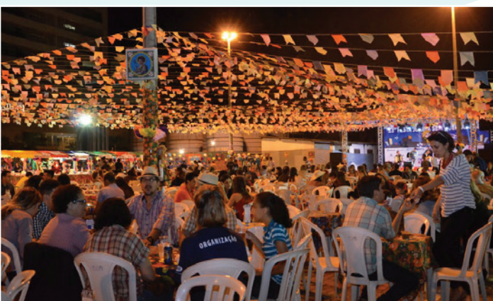
Realização da 13ª edição da “Festa Junina sem Queimaduras”, promovida pelo NPQ, em junho de 2015, na área de estacionamento do Goiânia Shopping