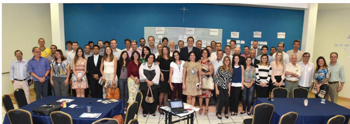
Desenvolvimento do projeto “O Futuro da Minha Cidade”, na sede do Sinduscon-GO