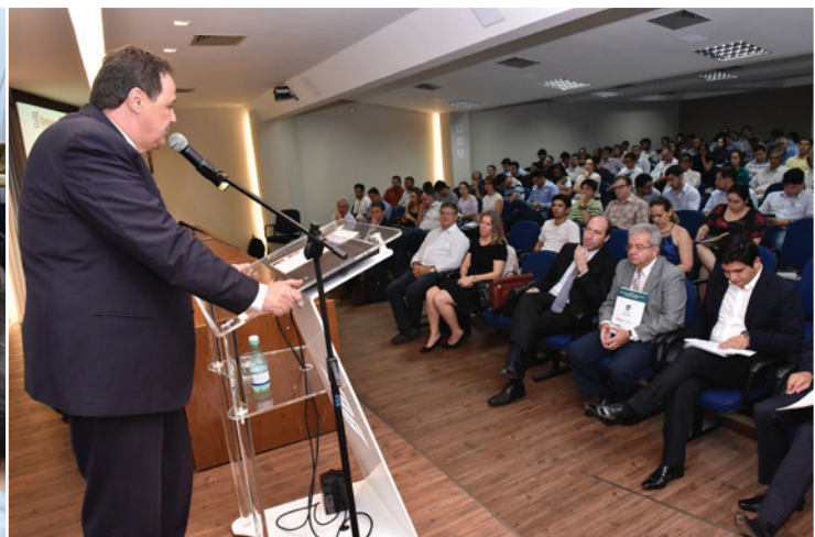
Fórum sobre Tecnologia do Concreto e Desempenho das Estruturas (Concretar)