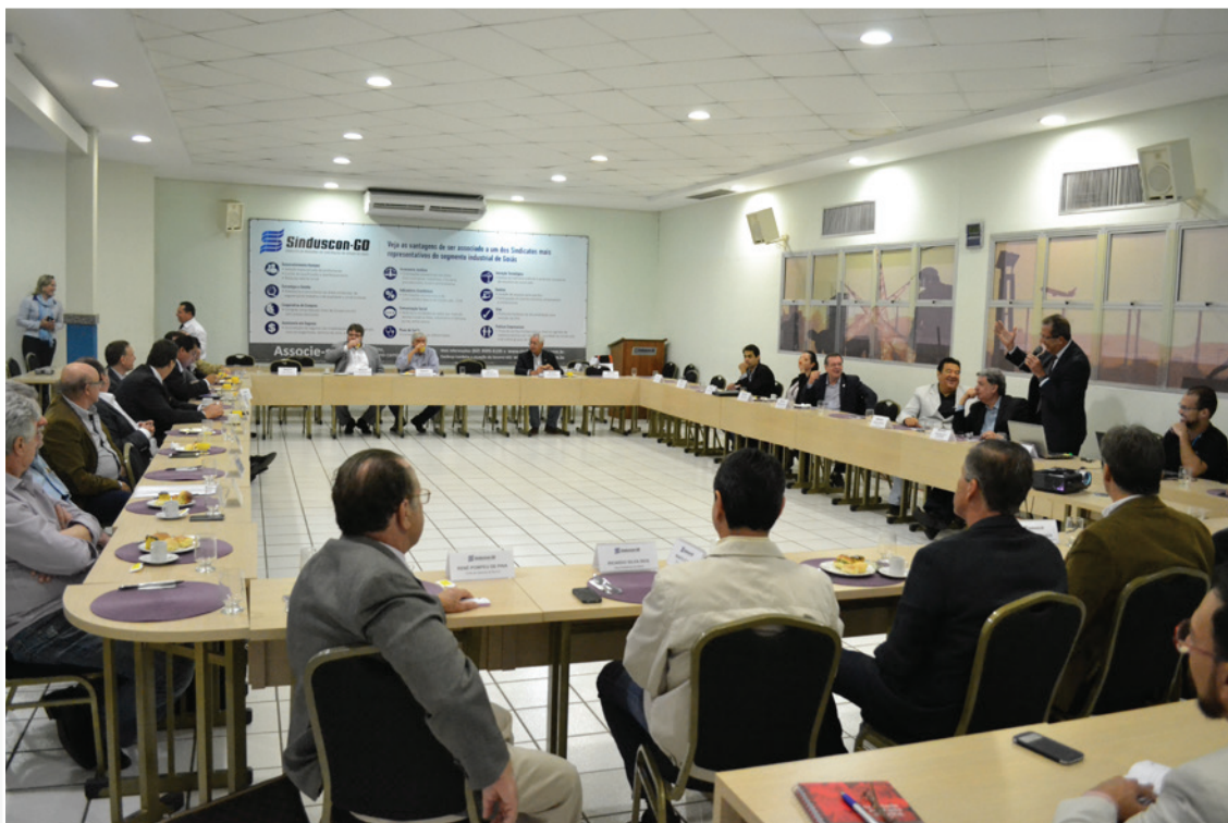
Reunião para tratar sobre o destravamento de obras rodoviárias na Região Metropolitana de Goiânia (RMG), com destaque para a retomada da obra do Contorno Viário da BR-153 (Anel Viário)