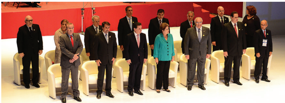
86º Encontro Nacional da Indústria da Construção (ENIC), realizado em Goiânia, de 21 a 23 de maio de 2014, no Centro de Convenções, com o tema “Cresce, Brasil. Com a nossa participação sempre!”

O Sinduscon-GO representa institucionalmente as empresas de seu segmento e busca desenvolver parcerias que promovam o bem estar da sociedade e o crescimento econômico não só de sua região, bem como do País.