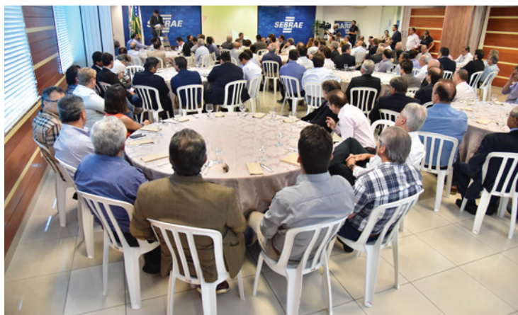
Reunião com membros fundadores do Codese na sede do Sebrae-GO, para desenvolvimento dos projetos prioritários

Contando atualmente com mais de 40 entidades parceiras, o Codese elaborou documento para subsidiar as decisões governamentais neste período com propostas para o desenvolvimento, chamado “Goiânia 2033 – O Centenário”. A proposta foi entregue a todos os candidatos a prefeito da Capital.