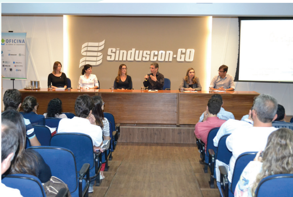
Em 18 de setembro de 2014, foi realizado o módulo sobre “Projetos”