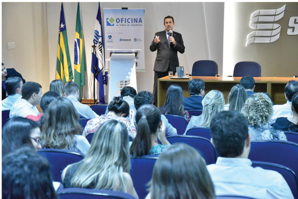
Em 03 de setembro de 2015, o tema foi “Incorporação Imobiliária”