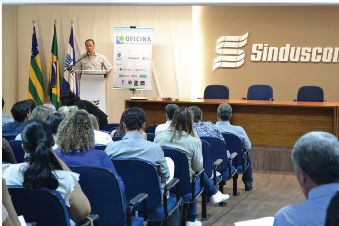
Em 25 de fevereiro de 2016 “Sistemas de vedações verticais em alvenaria” foi o tema abordado