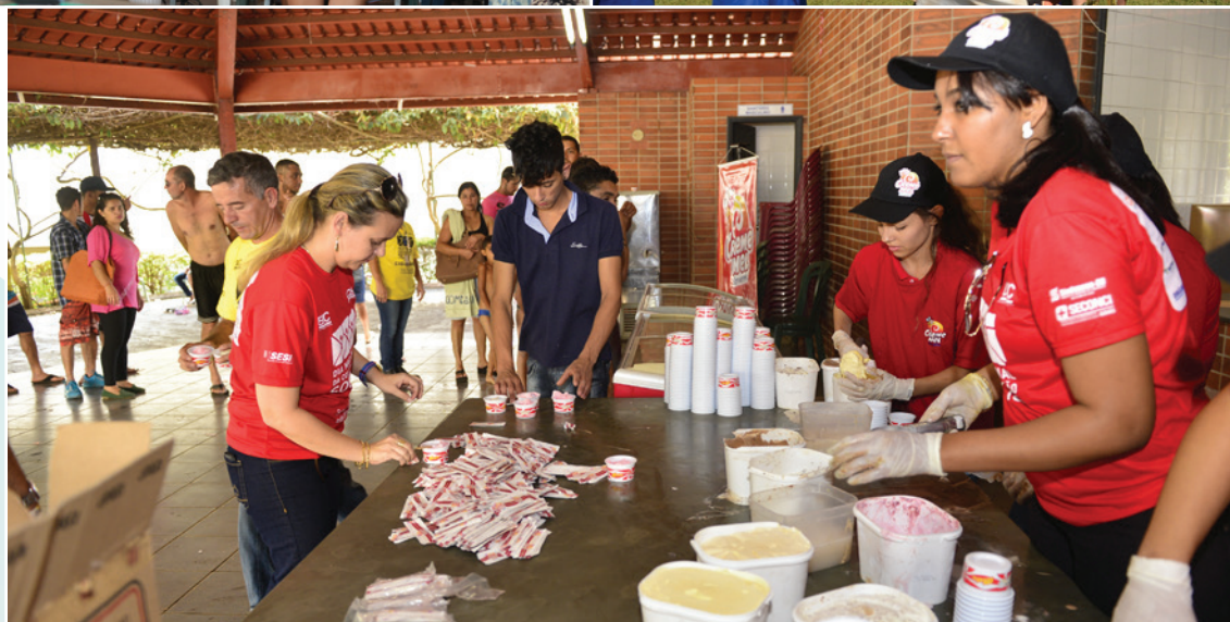
Realizado anualmente na Unidade Integrada Sesi/Senai Aparecida de Goiânia, o Dia Nacional da Construção Social beneficia os trabalhadores do setor e seus familiares com um dia de serviços gratuitos nas áreas de lazer, cidadania, saúde e educação