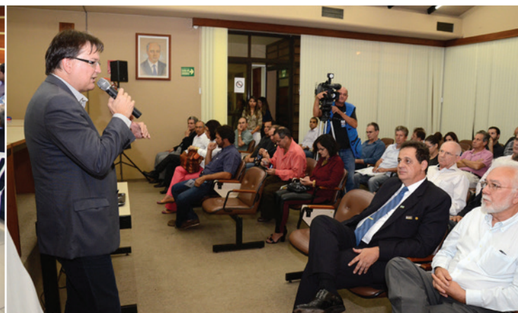
Reunião para formação do Codese, realizada na sede da Ademi-GO