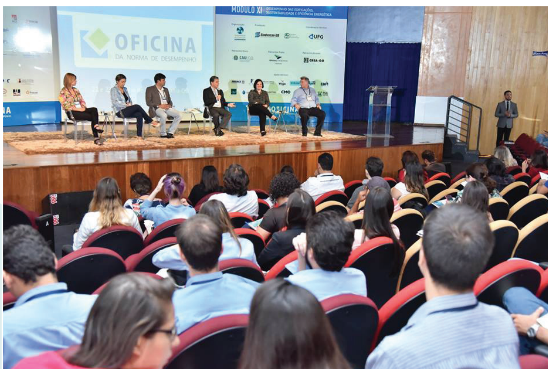
Em 22 e 23 de junho de 2016, foi realizado o XI Módulo da Oficina da Norma de Desempenho, com o tema "Desempenho das Edificações, Sustentabilidade e Eficiência Energética"